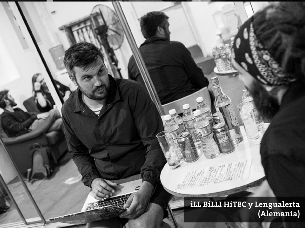
iLL BiLLI HiTEC y Lengualerta (Alemania)